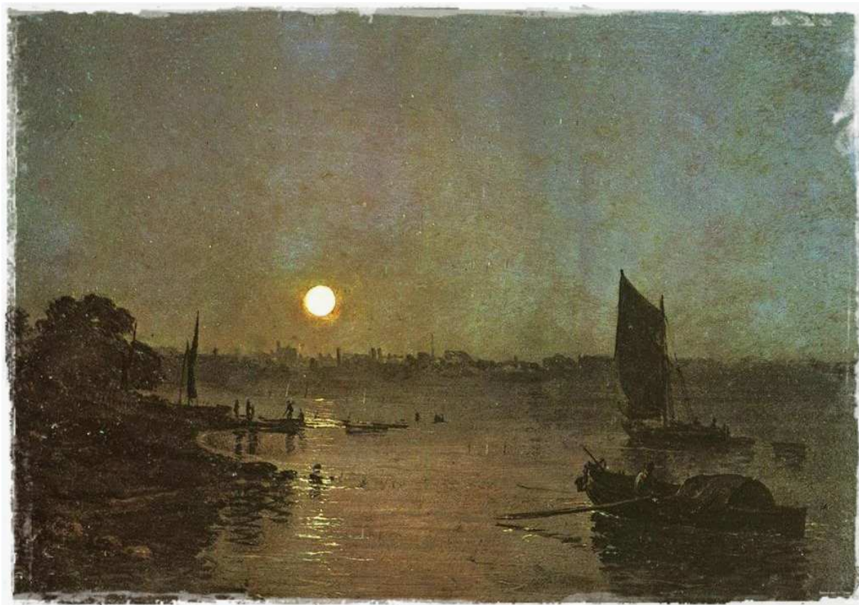
ภาพชื่อ Moonlight โดย William Turner

คัมภีร์ “มิลินทปัญหา” นั้นเป็นคัมภีร์สำคัญของพุทธศาสนา นิกายเถรวาท แม้ไม่ใช่คัมภีร์ชั้นต้นที่เรียกว่า “พระบาลี” แต่ก็ได้รับการยอมรับว่าสำคัญ อย่างน้อยก็ไม่แพ้ “อรรถกถา” ใน ประเทศเถรวาทบางประเทศเช่นพม่า มิลินทปัญหาถูกจัดเข้าใน พระไตรปิฎก คือไม่ได้เป็นอรรถกถาอย่างที่ไทยเราจัด ก็ยิ่งแสดงให้เห็นว่าตามทัศนะของประเทศเถรวาทที่ว่านั้น สถานะของคัมภีร์