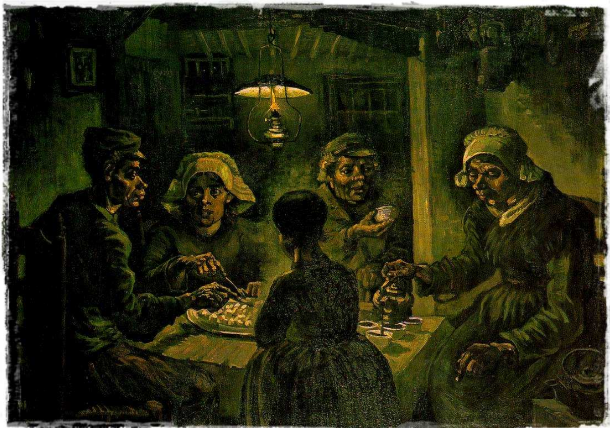
ภาพชื่อ Potato-Eaters โดย Vincent van Gogh