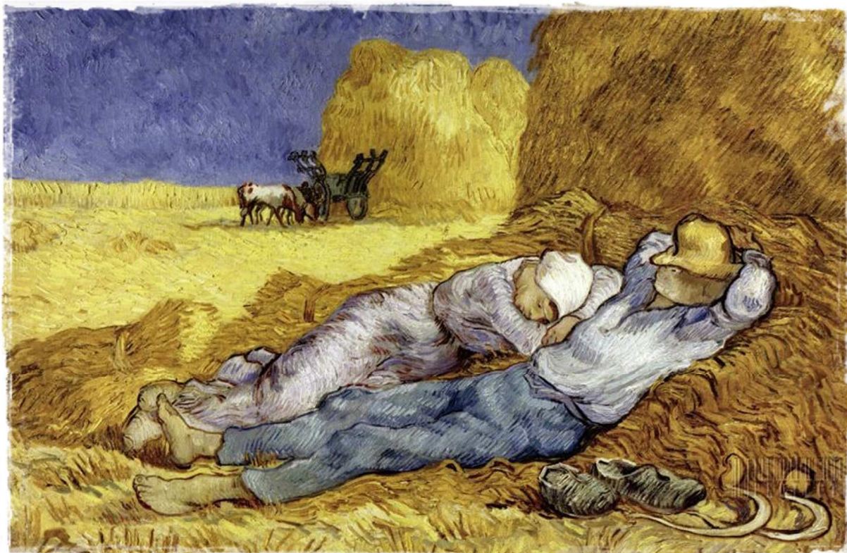
ภาพชื่อ Noon: Rest from Work โดย Vincent van Gogh

ในวิชาที่เราเรียนและสอนกันในภาควิชาปรัชญาทั่วโลกนั้น มีวิชาอยู่วิชาหนึ่ง เรียกกันในภาษาไทยว่า “ปรัชญาภาษา” เนื่องจากคำไทยที่ว่ามีคำในภาษาอังกฤษอย่างน้อยอยู่สองคำที่เราถือกันว่าเป็นที่มาของคำว่า “ปรัชญาภาษา” ในภาษาไทย และสองคำในภาษาอังกฤษนี้ก็มีความหมายต่างกัน ผมจึงใคร่ขอเริ่มต้นที่คำภาษาอังกฤษสองคำนี้ก่อน คำแรกคือ ‘Linguistic Philosophy’