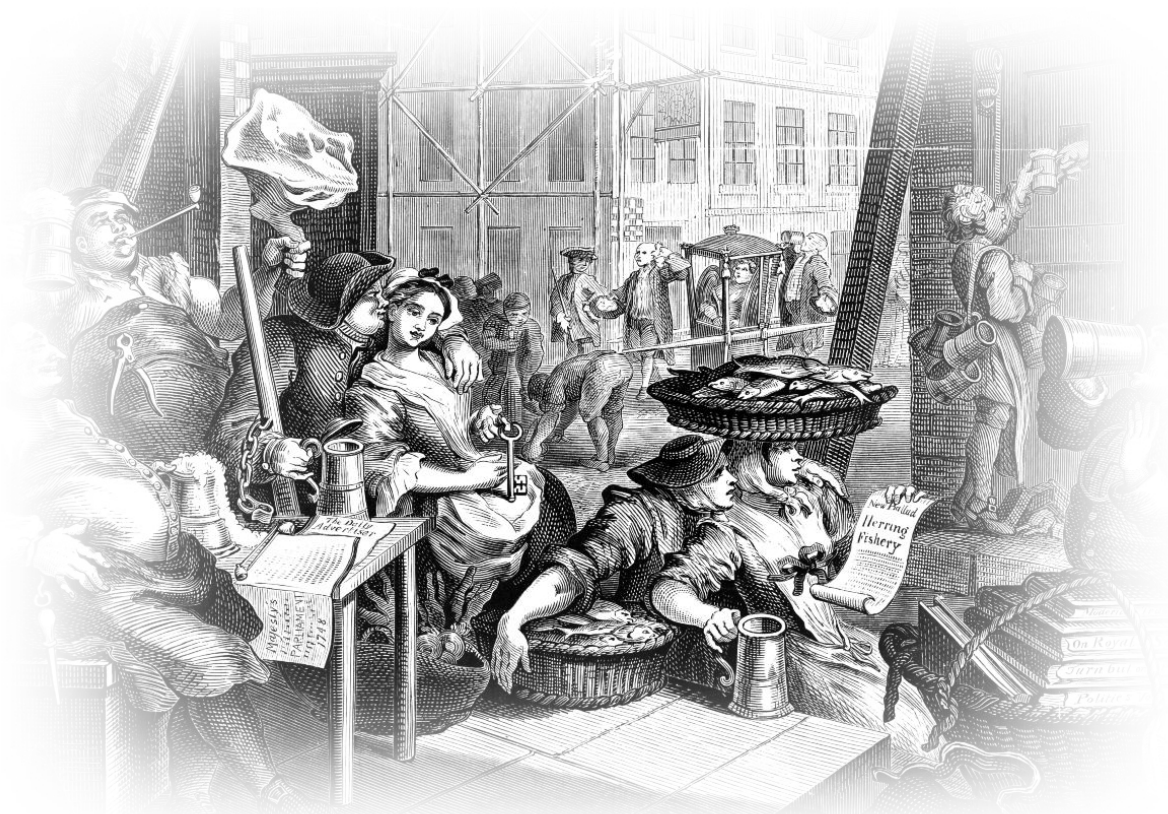
ภาพชื่อ Beer Street โดย William Hogarth

ชื่อของบทความนี้อาจไม่ค่อยตรงกับเนื้อหาจริงๆที่ผมจะกล่าวต่อไปเท่าใดนัก แต่เนื่องจากยังคิดหาหัวข้อที่ดีกว่านี้ไม่ออก จึงขอใช้ตามที่เห็นข้างต้นนั้นไปก่อน การถามว่า “สิ่งนี้คืออะไร” นั้นผู้ถามอาจมีจุดประสงค์ต่างกัน ผมจะลองจําระไนให้ดูตั้งนี้ครับ ประการแรก คำถามนี้เราถามเพื่อ