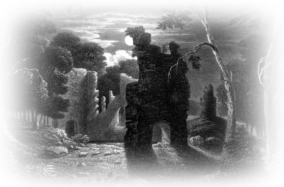
ภาพชื่อ Lochmaben Castle โดย William Miller

(๑) สมัยหนึ่งเมื่อครั้งยังเรียนหนังสือระดับมัธยมศึกษาอยู่ (ตอนนั้นผมบวชเป็นสามเณร) ในชั่วโมงวิทยาศาสตร์ ธรรมชาติ มีข้อความอยู่ข้อความหนึ่งที่ผมได้ยินบ่อยๆ ข้อความนั้นบางครั้งครูที่สอนวิทยาศาสตร์แก่พวกเราเป็นคนพูดเอง แต่บางครั้งก็มาจากตำราวิทยาศาสตร์ที่ครูใช้สอนพวกเรา